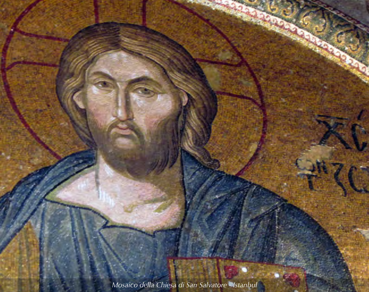
Mosaico della Chiesa di San Salvatore - Istanbul

quella bella serata stava facendo affiorare un disagio, incrinava le certezze... così quel dispiacere, che fosse scesa una sottile barriera tra noi, ci spinge a chiedere a un caro amico prete, molto preparato sull'esegesi, la sua opinione, un chiarimento. Però la sua risposta (allora questi miracoli avvennero o no ?) colta e circostanziata, piena di parentesi e riferimenti a testi, fu che "non si può dire né sì, né no" .