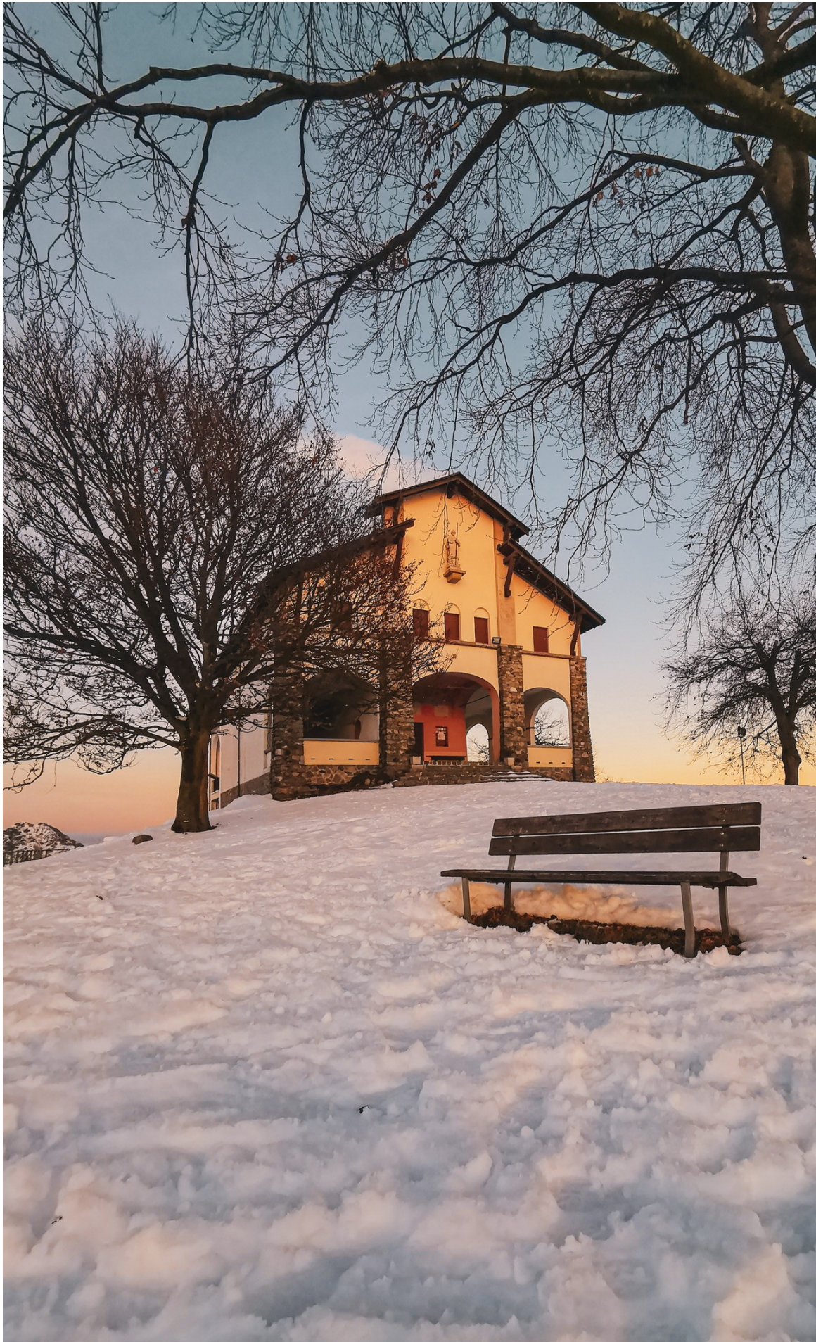
Santuario di S. Bernardo Valdilana (BI)