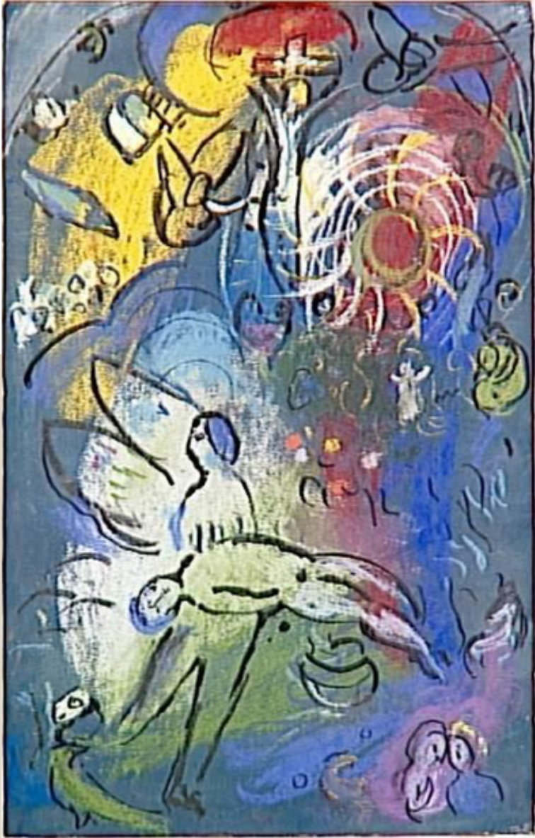
The creation of man - Marc Chagall 1960