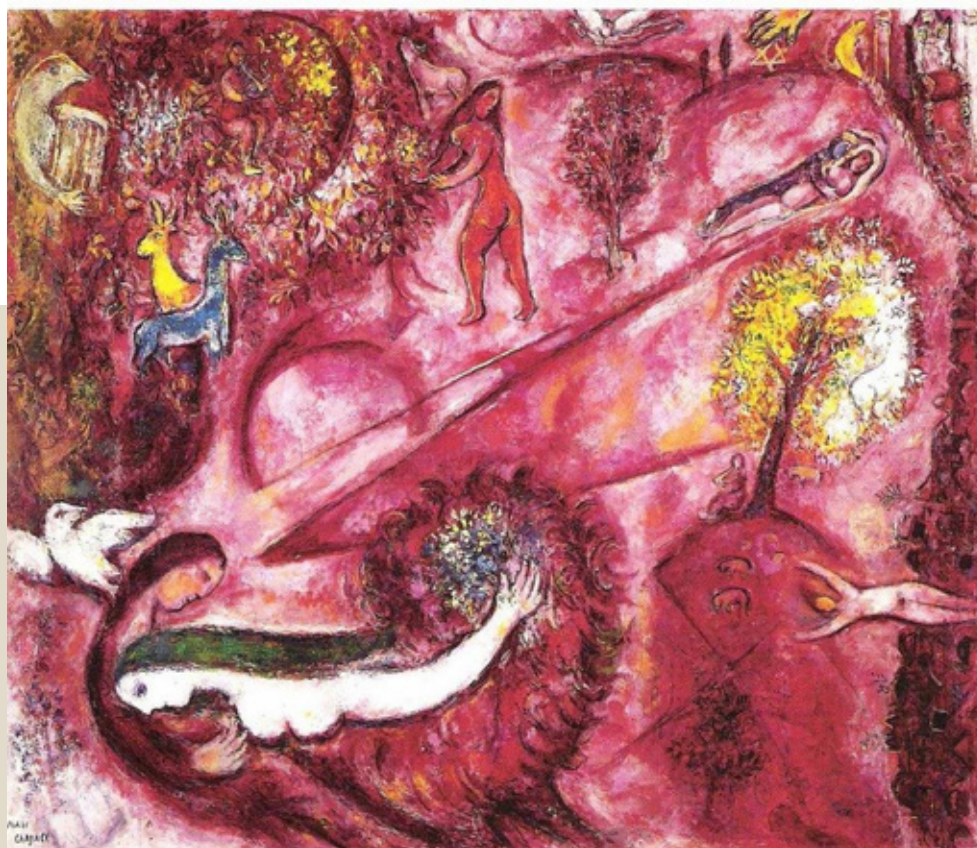
Cantico dei Cantici II (1954-1957, Marc Chagall)