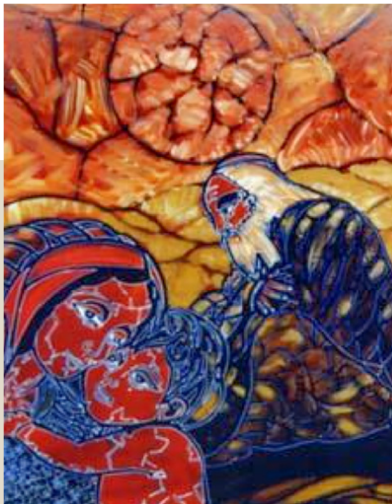
Anna Madre di Samuele (1954-1957, Marc Chagall)