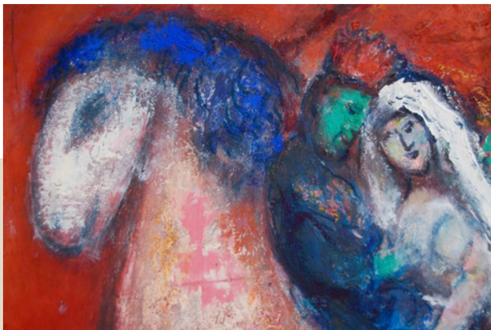
Davide e Betsabea (1954-1957, Marc Chagall)