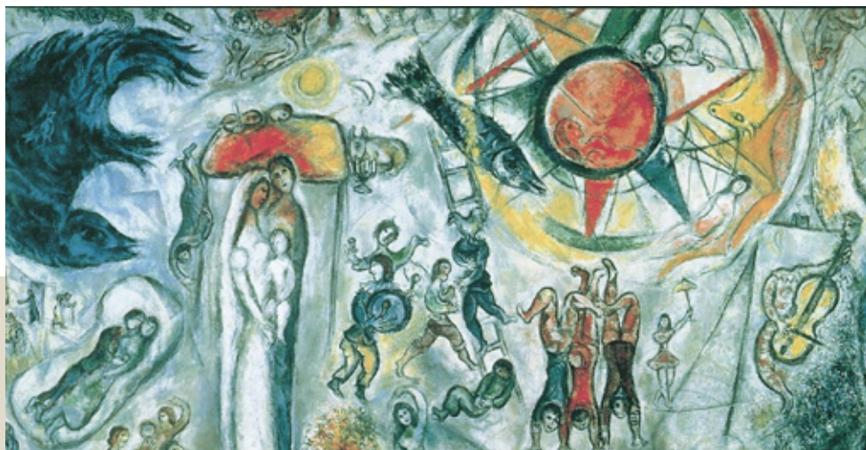
La vita (1954-1957, Marc Chagall)