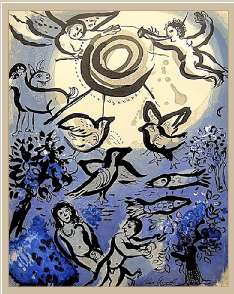
The creation - Marc Chagall 1960

OLTRE OGNI MURO PREGHIERA PER COSTRUTTORI DI PONTI