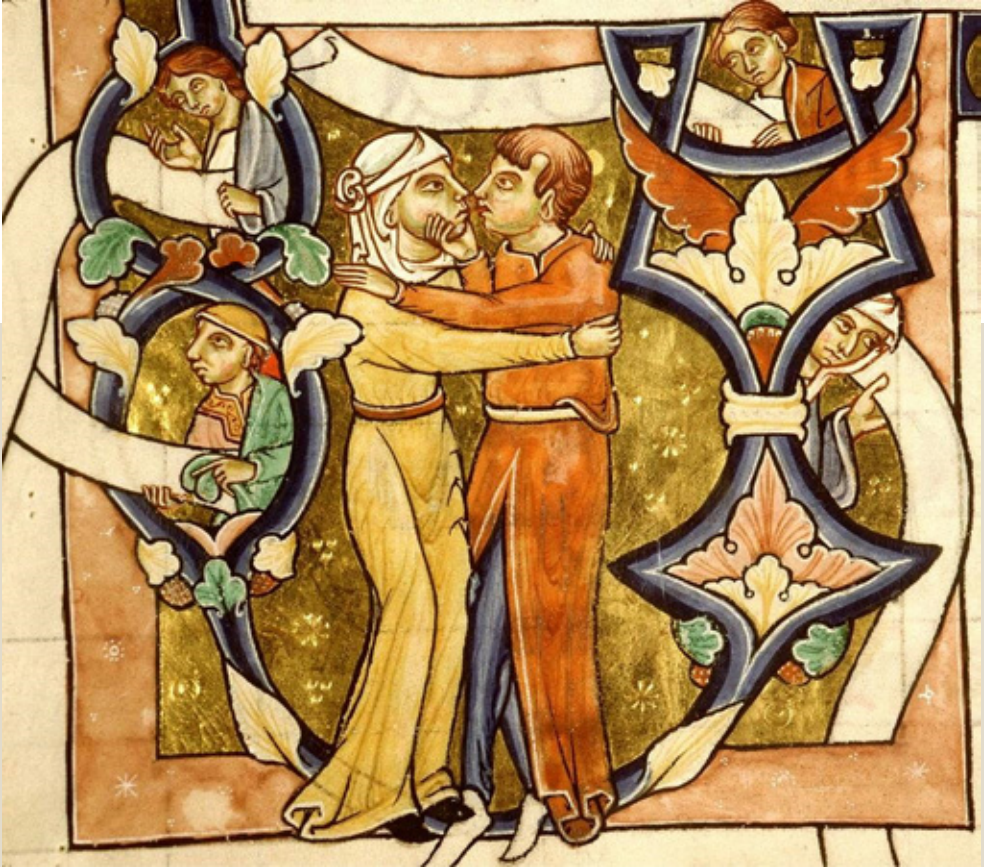
“Osea e Gomer”, miniatura tratta dalla ‘Bibbia di Manerius’ (1185-1195 circa), Bibliothèque de Sainte-Geneviève, Parigi