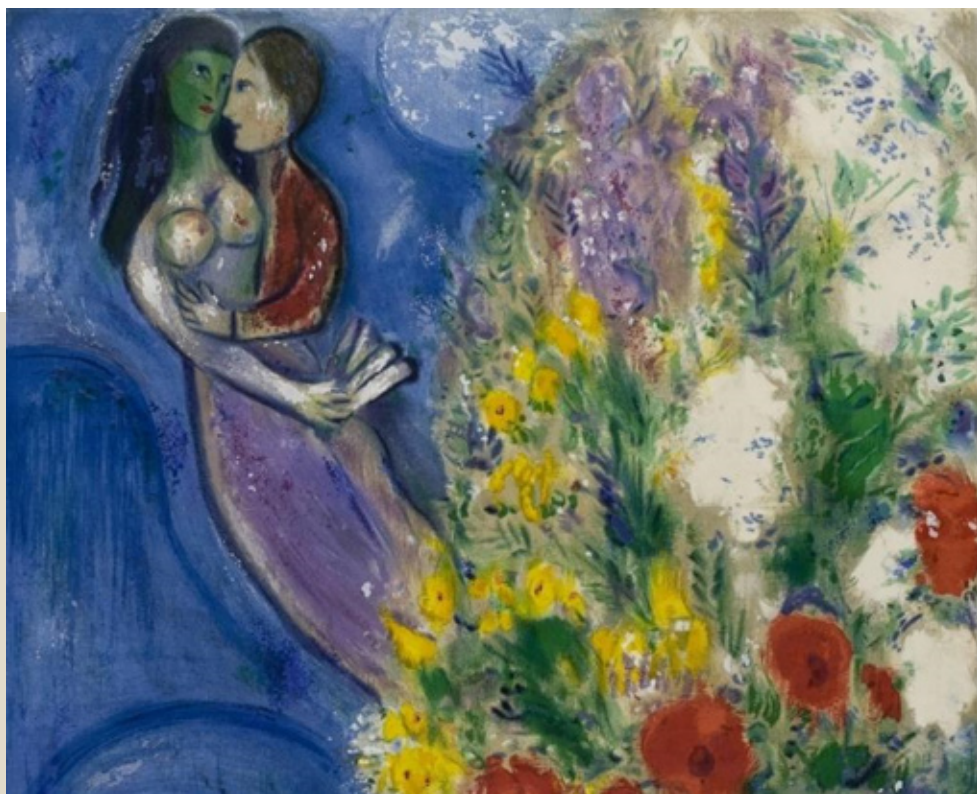
Love and Life (1954-1957, Marc Chagall)