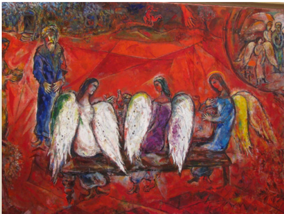
Abraham and three Angels (1954-1957, Marc Chagall)