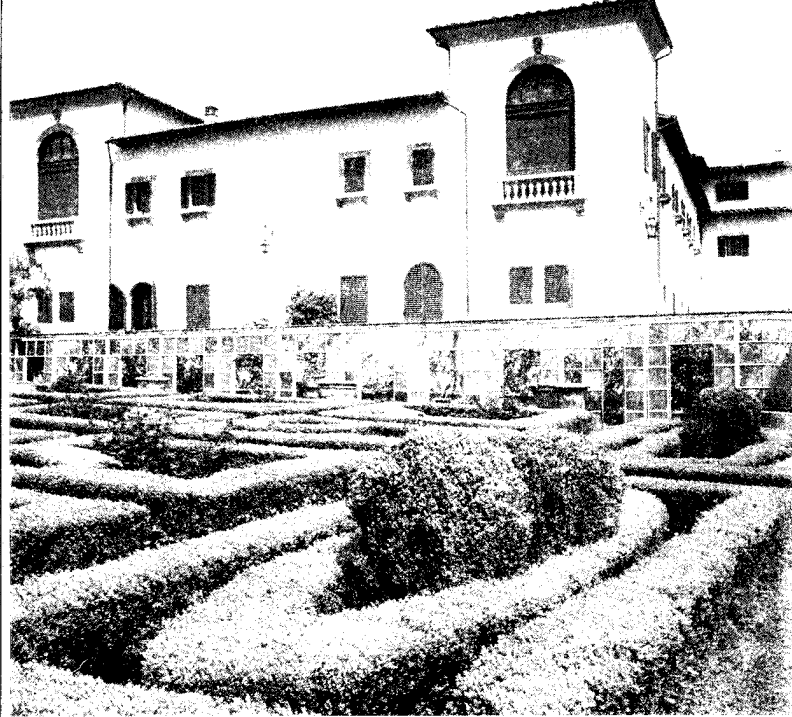
Prato: Villa di S. Leonardo al Palco dove si incontreranno i responsabili di Settore.