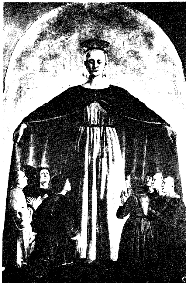
Piero della Francesca. Madone de la Misericorde .