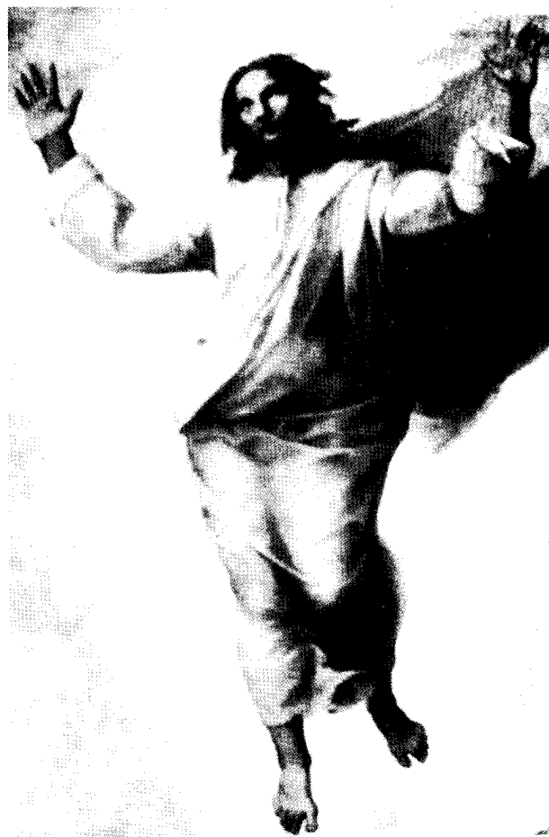
La Trasfigurazione di Raffaello

Orientamento del movimento per il 1985 - 1986: SIATE SEMPRE PRONTI A RISPONDERE A CHIUNQUE VI DOMANDI RAGIONE DELLA SPERANZA CHE È IN VOI