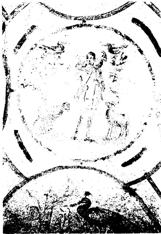
Il buon Pastore - affresco III secolo - Catacomba di Priscilla - Roma

Orientamento del movimento per il 1985 - 1986: SIATE SEMPRE PRONTI A RISPONDERE A CHIUNQUE VI DOMANDI RAGIONI DELLA SPERANZA CHE È IN VOI