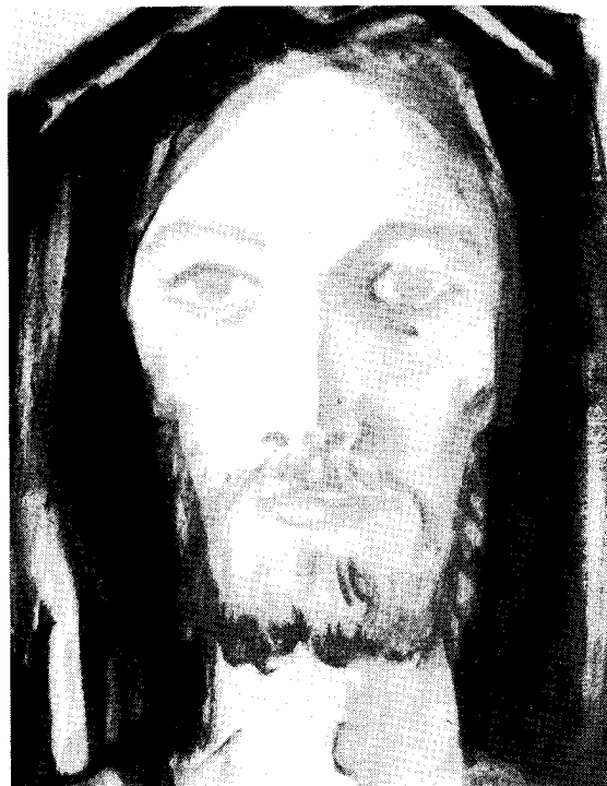
«CRISTO RISORTO» di P. Secondo Pastore da «Uomini con gli Uomini» mensile missionario

Orientamento del movimento per il 1985 - 1986: SIATE SEMPRE PRONTI A RISPONDERE A CHIUNQUE VI DOMANDI RAGIONE DELLA SPERANZA CHE È IN VOI