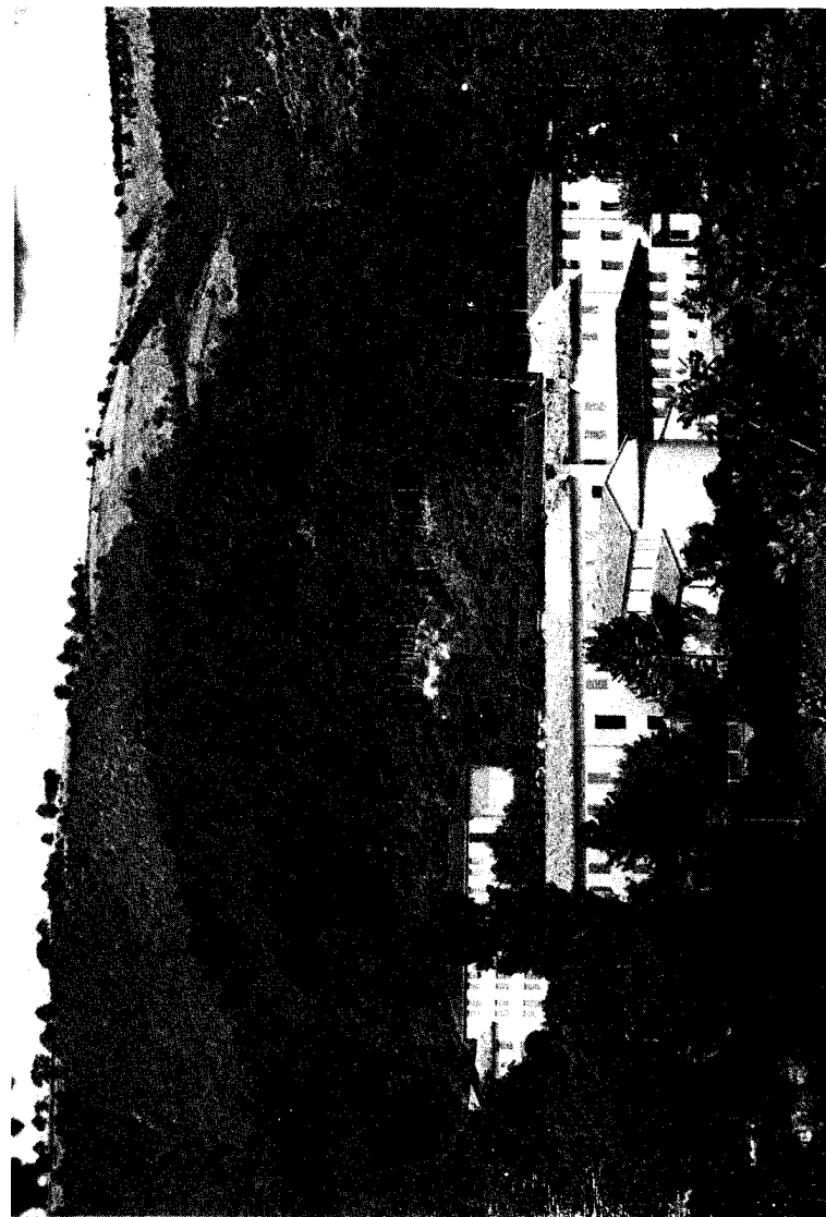
Insero alla «Lettera delle E.N.D.» n. 41 - gennaio - febbraio 1987

5 - Speranza è attesa, ma non inerzia; è attività, ma non attivismo. Sperare è camminare, cercare, fare, dare. Troveremo solo ciò che avremo cercato. Eppure, ciò che speriamo è al di là del frutto del nostro operare: qualcuno mi regalerà qualcosa. Noi non ci facciamo da soli, siamo fatti dal dono, dalla grazia.