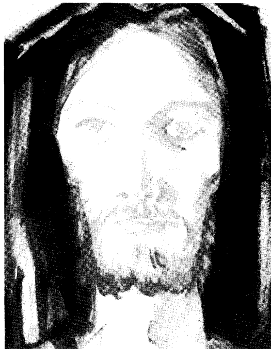
«CRISTO RISORTO» di P. Secondo Pastore da «Uomini con gli Uomini» mensile missionario

Orientamento del movimento per il 1986 - 1987