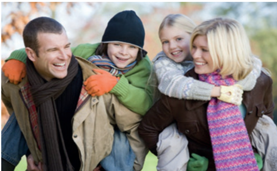
Foto di famiglia