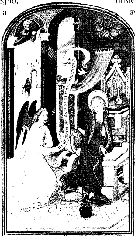
L'annuncio alla Vergine Miniatura francese del XV secolo

e ricchezza. Sicuramente un metodo che produce molti frutti è "l'adozione a distanza", che preferiamo però chiamare "matrinato" (ben sapendo cos'altro significhi adottare). Si tratta infatti di contribuire economicamente per permettere ad un bambino del terzo mondo di frequentare la scuola, di crescere nella sua famiglia. Grande successo hanno ora altre forme di sostegno, i "microcrediti" a famiglie o quartieri (spesso a donne sole con figli) che permettono di intraprendere attività lavorative nuove o di realizzare progetti (per esempio scuole). Esistono anche forme di sostegno alle famiglie perché possano accogliere in adozione o in affido bambini rimasti soli. Moltissime sono nei paesi poveri le famiglie