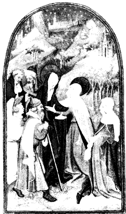
Maria visita Elisabetta Miniatura francese del xv secolo

E così, ad un certo punto, abbiamo iniziato a sentirci a disagio nel frequentare la Chiesa