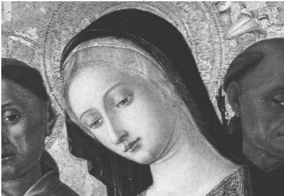
Madonna col Bambino e Santi, particolare Matteo di Giovanni

(...) Attaccare l'Afghanistan e uccidere la sua gente più derelitta e sofferente, non allevierà in alcun modo il lutto del popolo americano". Non aumenterà la sicurezza del Nord.