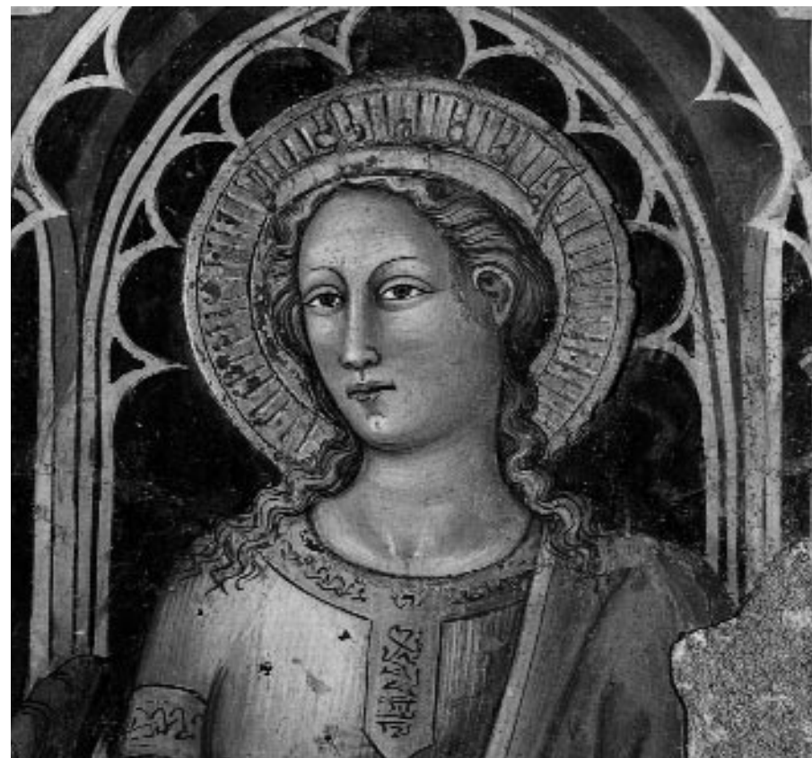
S. Caterina affresco della scuola Bicci di Lorenzo

ancora un “si” al servizio nelle END dopo tanti anni di impegno, ma poi ha prevalso l'amore per questo Movimento nel quale siamo entrati due mesi dopo il nostro matrimonio e che ci ha accompagnato per tutti questi anni, segnando in modo profondo la nostra storia coniugale. Queste sono fundamentalmente le ragioni del nostro sì, come pure abbia-