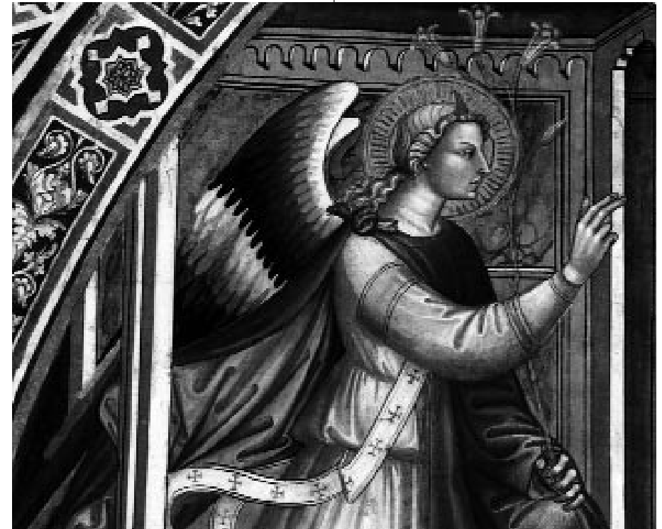
Angelo Annunziante affresco della scuola Bicci di Lorenzo

Intendiamoci: da questo tutti vi riconosceranno come persone umane nel progetto di Dio.