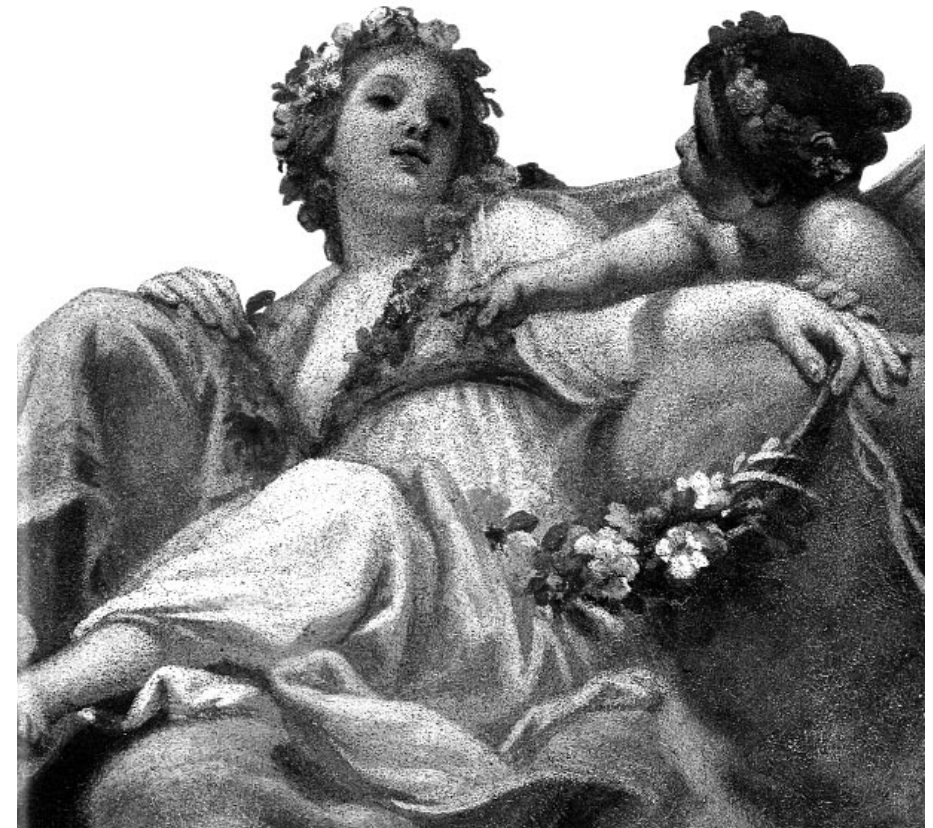
Sala della Musica, particolare G.B. Tempesti