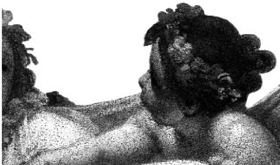
Sala della Musica, particolare G.B. Tempesti