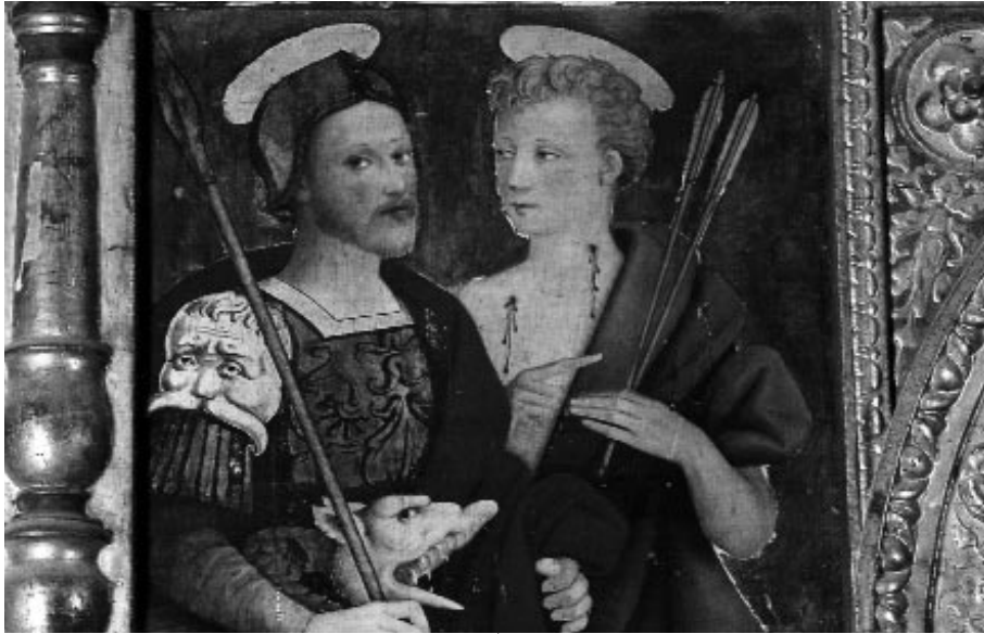
Ss. Rocco e Sebastiano Raffaello De Rossi

Nelle lunghe ore in cui sono rimasto, come centinaia di milioni di persone di tutta la Terra, seduto davanti al televisore, quasi ipnotizzato, guardando quel cielo senza luce mi è capitato di ripensare a un verso di Shakespeare: "Questo mattino reca una lugubre pace. Il sole, per il dolore, non vuole mostrare il suo volto". Quel verso sta in "Romeo e Giulietta", tenera storia di due giovani sposi ma anche terribile racconto di un odio insensato; e certo la parola "pace" voleva dire silenzio stupefatto, orrore, senso di inermità davanti a un tetro capolavoro del male. E' la "pace" che