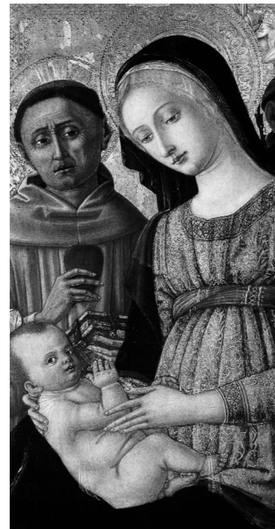
Madonna col Bambino e Santi Matteo di Giovanni