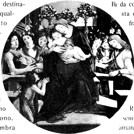
Botticelli "Madonna col bambino, S. Giovannino e angeli" Roma - Galleria borghese

Sono ancora molti, anche fra giovani, che ritengono che il "sacrificarsi" per l'altro per amore sia un gesto di libertà. E addirittura sostengono tale convinzione appoggiandosi alla parola di Dio che sembra invitare alla "rinuncia di sé" per l'altro: "Chi non rinnega se stesso, non può essere mio discepolo".