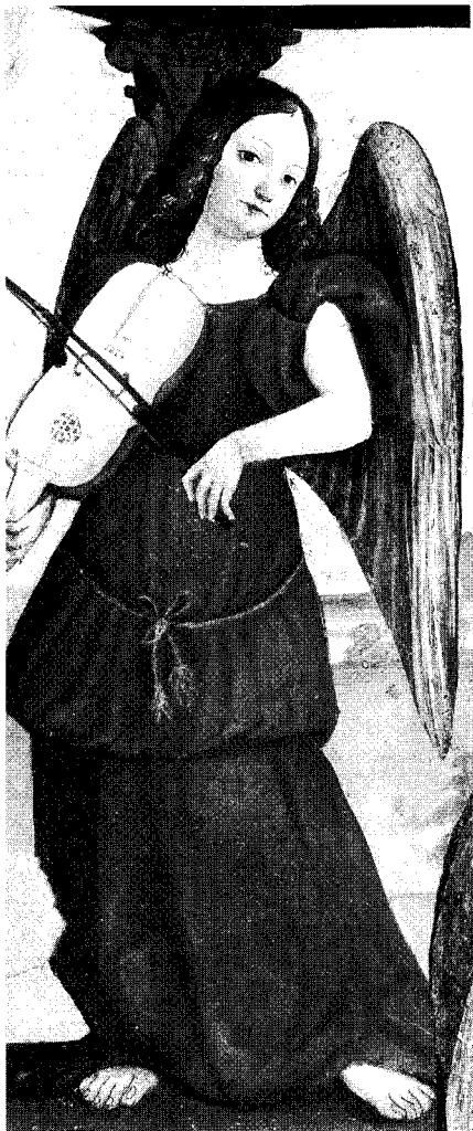
"Angeli musicanti" - 1520 Cuneo - S. Giovanni Evangelista

Chiesa, ad assumere più pienamente le nostre responsabilità apostoliche e