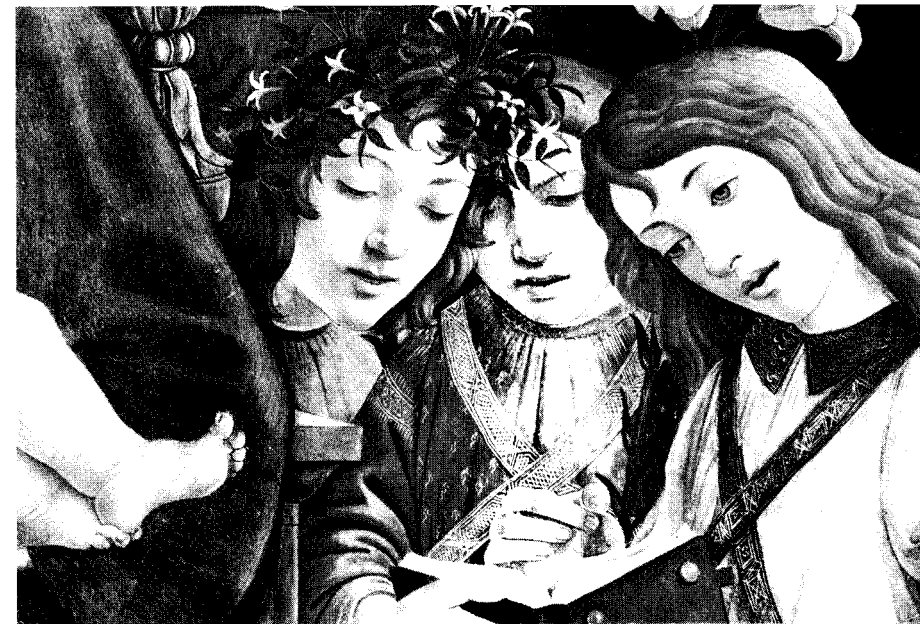
Botticelli "Madonna" dettaglio di tre angeli cantori - Roma - Galleria Borghese

la risposta a tutti i nostri bisogni, e il matrimonio è un sacramento di grazia, che attiva il dinamismo di superamento delle nostre debolezze. Ogni giorno Egli trasforma in realtà – e i credenti ne hanno l'esperienza – il motto di San Paolo: « E' quando sono debole che mi sento più forte, perché non sono io, ma la virtù di Cristo che abita in me... » (2 Cor. 12, 5).