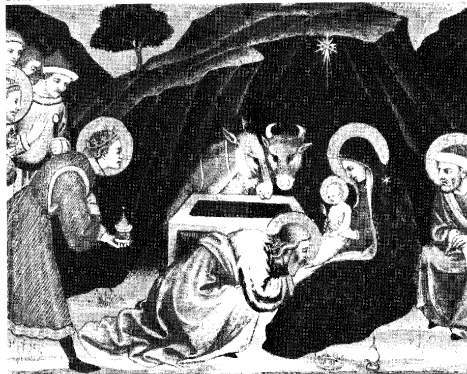
Taddeo di Bartolo "Adorazione dei Magi" Siena - Pinacoteca Nazionale

Ospitare l'altro vuol dire accoglierlo com'è. Lo sposo ospita la sua sposa quando la ama e la accoglie com'è senza voler cambiare le sue idee e le sue prospettive. Il tentare di convertire l'altro è un modo per non ospitarlo. Gesù, come scrive un teologo francese, non andava dai peccatori per convertirli, ma per amarli. Sentendosi ospitati da questo amore essi entravano in sé e li irrompeva la forza per uscirne. Se questa ospitalità trascolasse nelle relazioni tra culture e popoli, potrebbe maturare una convivenza pacifica e felice.