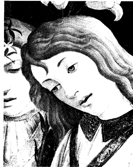
Botticelli "Madonna" particolare - Roma - Galleria Borghese

abbiamo fatto a Siena, non hanno mai preteso di essere una chiesa nella Chiesa. Un loro obiettivo consiste invece nel vivere la ricchezza del sacramento come chiesa, prima nel piccolo della famiglia e poi nel respiro più ampio, costituito dalla chiesa locale e universale.