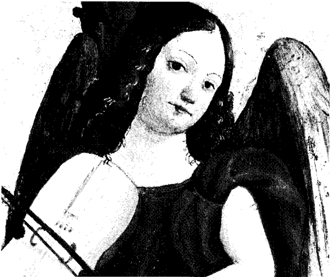
"Angeli musicanti" - particolare 1520 - Cuneo - S. Giovanni Evangelista

vare delle vie per correggere l'attuale sistema economico che rende i ricchi sempre più ricchi e i poveri sempre più poveri. È un impegno che nasce anche dalla fede. Non possiamo sentirci a posto in coscienza finché c'è un povero che soffre.