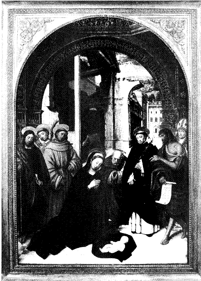
"Adorazione del bambino" Defendente Ferrari - Torino