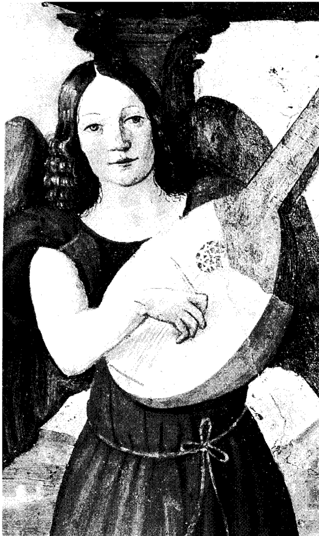
"Angeli musicanti" - 1520 Cuneo - S. Giovanni Evangelista

dinamica e feconda, proprio lì dove si trova insediato un centro fra i più attivi della camorra, del commercio illegale, della criminalità organizzata nel napoletano. E qui negli anni passati c'è stata, c'è tuttora, una presa di coscienza e un'attiva presenza di chiesa, soprattutto dove è stata particolarmente vivace ed efficace l'azione di alcuni gesuiti, che hanno saputo animare comunità cristiane conciliari ed evangeliche, aperte alle attività di catechesi, di alfabetizzazione, di animazione di strada, di case famiglia, consultori. Molte coppie del settore Campania vengono da Scampia. Soprattutto quelle delle équipes Napoli 1 e 2 sono state arricchite da esperienze