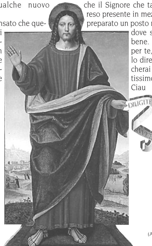
Ambrogio da Fossano

Diligite invicem (Amatevi gli uni gli altri)