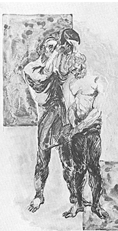
Battesimo di Cristo

Come una persona che per lavoro percorre ogni giorno sempre la stessa strada rischia di non vedere più né la strada stessa, né il paesaggio intorno, né i cambiamenti stagionali,