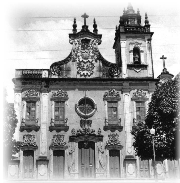
Chiesa del Carmine a João Pessoa

Dopo questa rapida panoramica sulla Chiesa in Brasile ricordandoci del brano "dobbiamo ancora percorrere un lungo cammino" (1 Re 19,7) non possiamo non ricordarci che la nostra Chiesa perde fedeli mentre aumenta sia il numero delle persone che dicono di essere "credenti" pur rifiutando la loro appartenenza alla Chiesa, sia il numero di coloro che si dichiarano "non credenti in Dio". I nostri ministri ordinati sono insufficienti e mal distribuiti sul territorio nazionale; alcune strutture eccle-