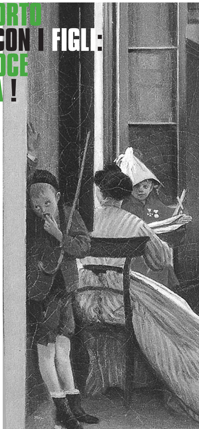
Adriano Cecioni Il gioco interrotto

Siamo una coppia che nelle sue aspettative coniugali ha messo, fin dal fidanzamento, la possibilità di avere dei figli e di educarli secondo i canoni ortodossi di una vita morale e spirituale. La grazia del Sacramento del matrimonio ci ha aiutato in tale progetto e così è stato fino alle soglie della pubertà dei nostri figli: tre doni di Dio, che hanno attualmente 21, 17 e 16 anni. Con la scuola secondaria superiore il rapporto con loro ha cominciato ad avere sempre più spesso i connotati dello scontro verbale, della dialettica vivace, della sofferenza interiore. Il motivo precipuo è la decisione per scelte diverse da quelle pro-