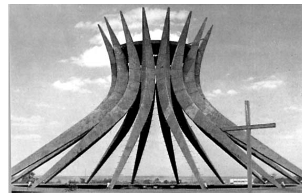
La cattedrale di Brasilia

È interessante osservare che per la prima volta la coppia Responsabile del Movimento in Brasile proviene dallo Stato del Rio Grande do Sul e non da Sao Paulo come in precedenza.