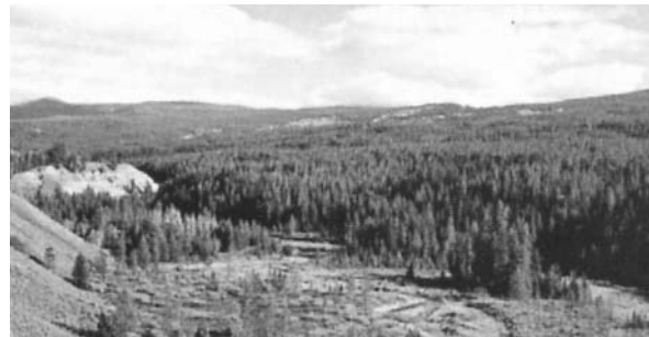
Wyoming: Grand Teton National Park

un grosso lavoro di informazione e di preparazione delle coppie pilota, la Super Regione ha potuto fare conoscere le Equipes Notre Dame a nuove coppie in tutto il paese.