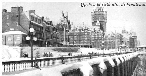
Quebec: la città alta di Frontenac

Nel corso dell'anno 2004, più di 250 nuove coppie e consiglieri spirituali sono entrati nel Movimento. Grazie ad