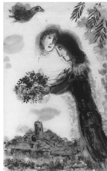
Marc Chagall Coppia con bouquet

Nella costituzione Lumen Gentium si afferma: “...i coniugi cristiani, in virtù del sacramento del matrimonio, col quale essi sono il segno del mistero di unità e di fecondo amore che intercorre fra Cristo e la Chiesa, e vi partecipano (cf. Efesini, 5, 32), si aiutano a vicenda per raggiungere la santità nella