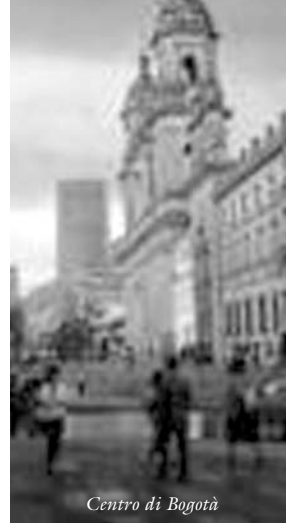
Centro di Bogotá

Nel mese di agosto 2000 la nuova Coppia Responsabile ed il Consigliere Spirituale della Super Regione hanno iniziato il loro servizio e per la prima volta nella