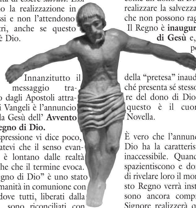
Nino Capetti Cristo che accoglie

È vero che l'annuncio del Regno di Dio ha la caratteristica di un'utopia inaccessibile. Quando i discepoli si spazientiscono e domandano a Gesù di rivelare loro il momento in cui questo Regno verrà instaurato, non possono ancora comprendere come il Signore realizzerà questo fonamen-