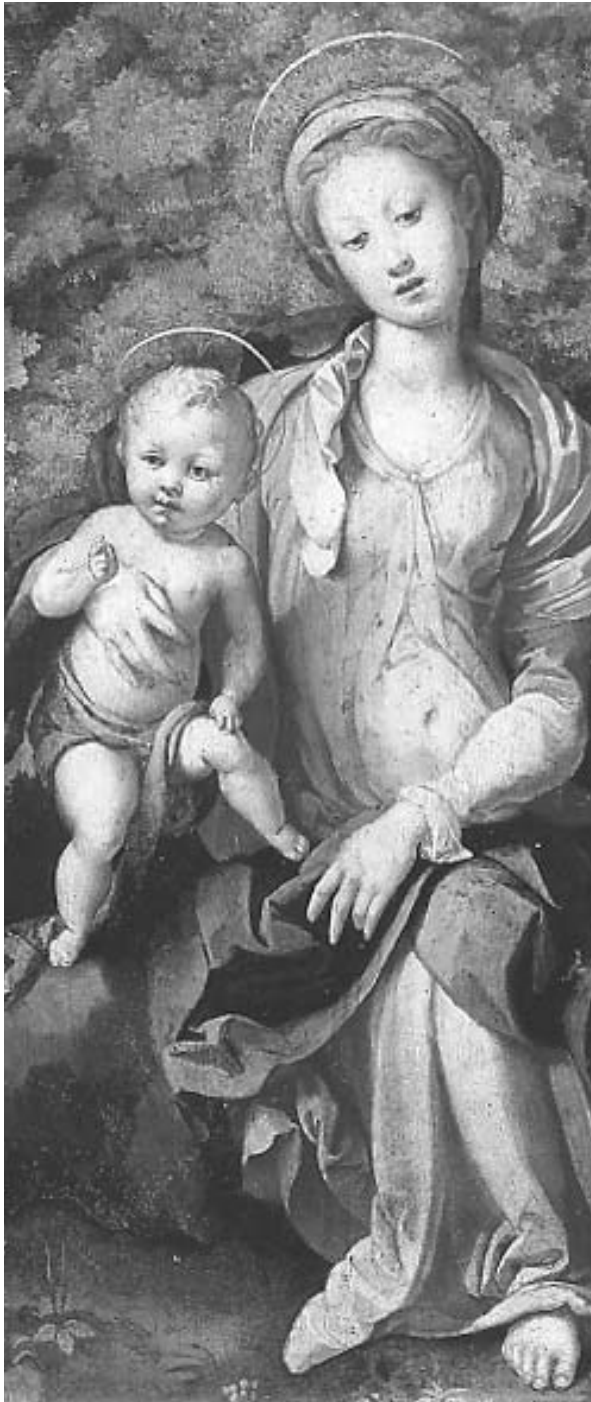
Jacopo Carucci detto il Pontormo