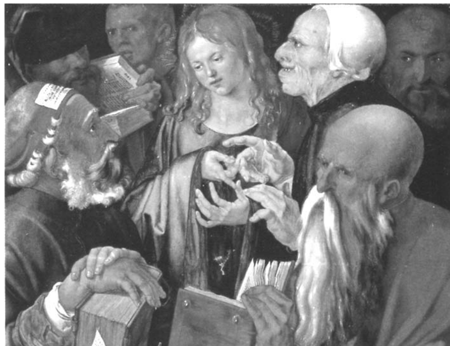
Nella pagina accanto: Albrecht Dürer - Gesù tra i dottori

che spesso gela i rapporti interfamiliari quando le idee non collimano, ma un silenzio di riflessione che fa maturare un atteggiamento di gioiosa adesione. Comprendono che su “quel figlio” c'è un progetto del Padre e che lui ha in proposito le idee chiare.