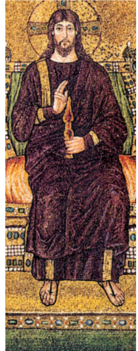
Cristo benedicente in trono fra quattro angeli, particolare, Ravenna, Sant'Apollinare Nuovo