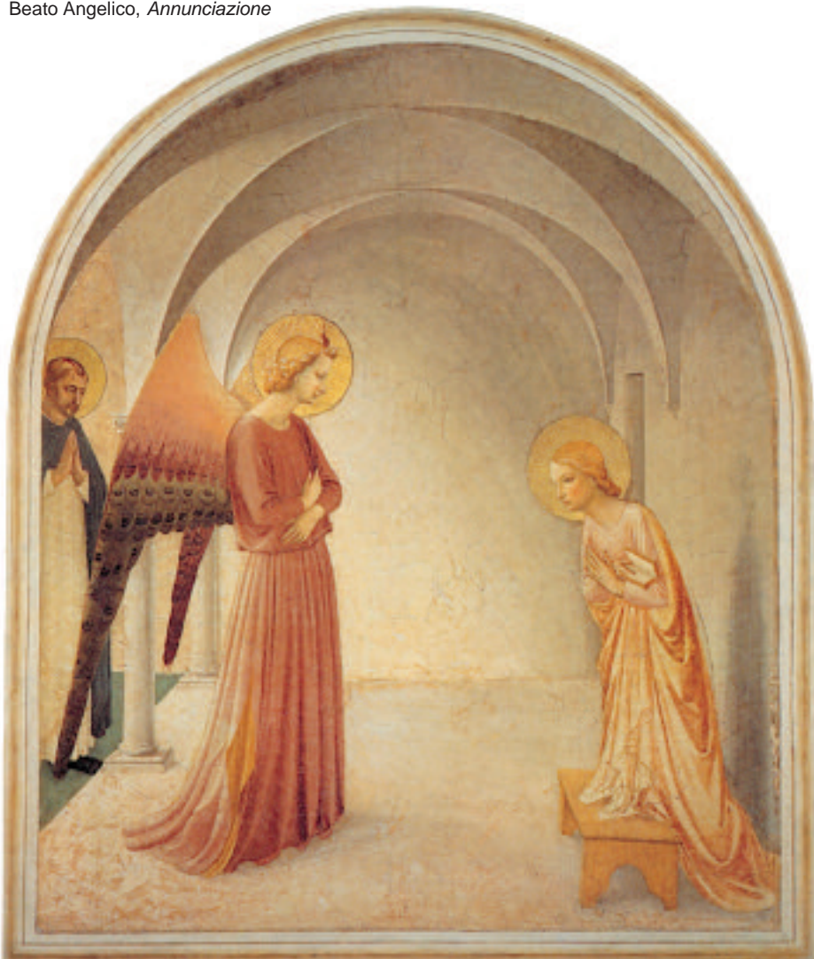
Beato Angelico, Annunciazione

compito altissimo, ad una missione unica per la salvezza del suo popolo. Prima che lei, con libera decisione, si riconoscesse al servizio del Signore, da sempre egli l'aveva scelta e costituita sua "serva".