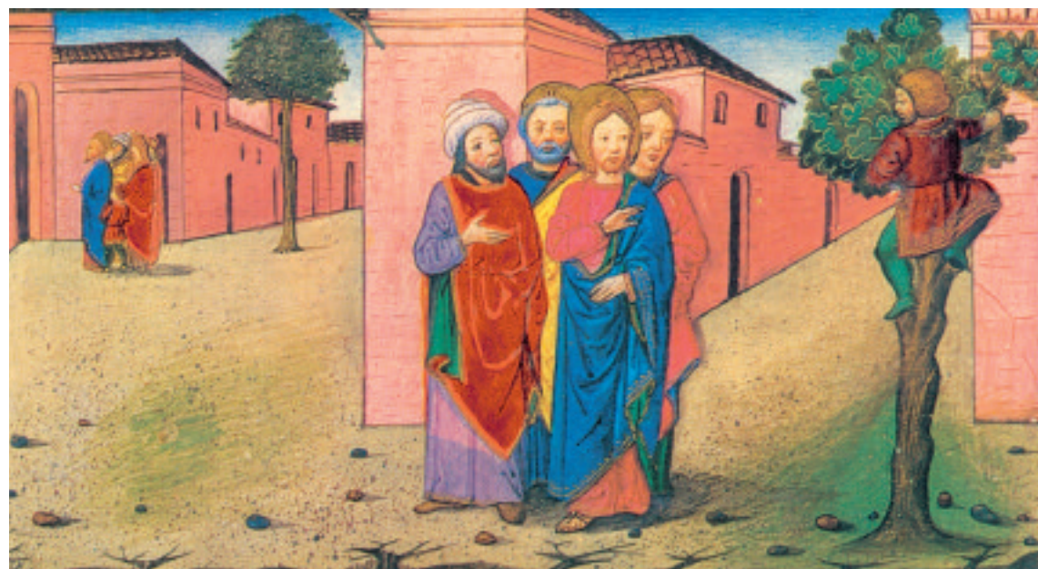
Cristoforo De Predis, Gesù parla a Zaccheo

Tuttavia anche in questo, come in ogni altro passo del Vangelo, il centro della vicenda narrata non è Zaccheo, ma Cristo Gesù. Il fulcro della scena, infatti, il suo contenuto rivelativo, non è l'affannosa ricerca di Zaccheo, il suo salire e scendere e correre, ma il fatto che è Gesù ad avere cercato proprio lui, Zaccheo, e ad averlo trovato . Non per caso: infatti, "Oggi devo fermarmi a casa tua". E allora, Zaccheo: "Scendi subito".