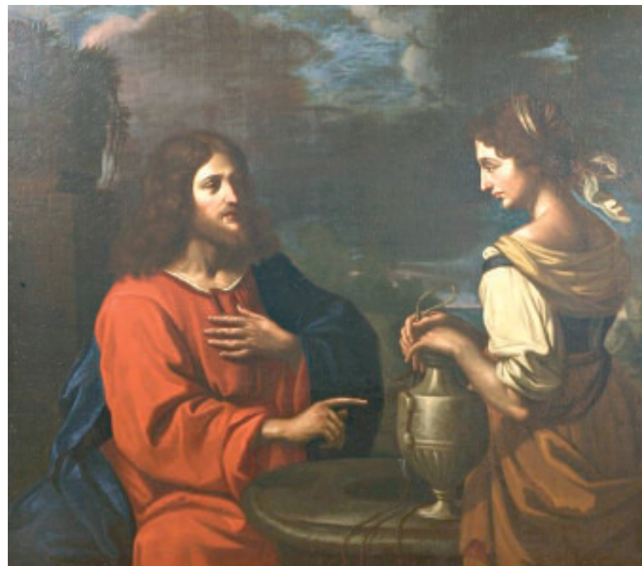
Guercino, Cristo e la samaritana

La struttura letteraria del versetto giovanneo porta con sé una potenza rivelatrice: la prima parte ("Se tu conoscessi il dono di Dio") è in parallelo con la seconda ("Chi è colui che ti dice"), e questo parallelismo dimostra che