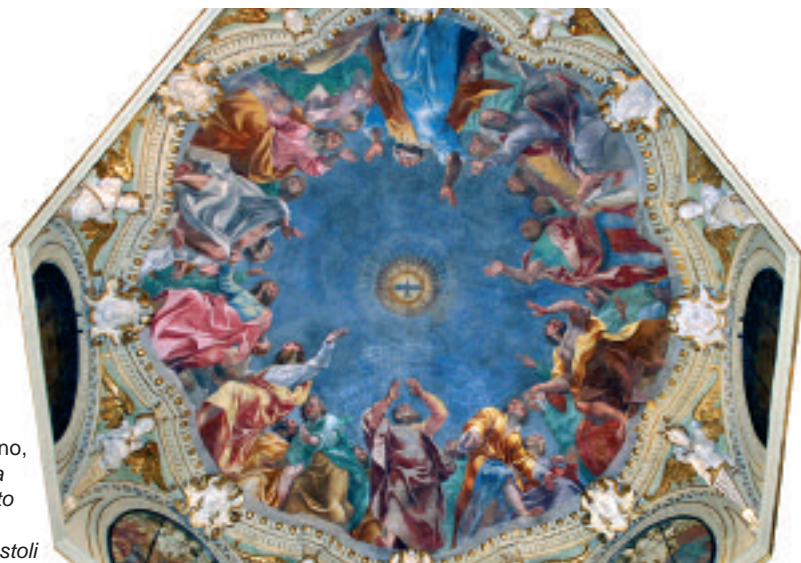
Carlo Urbino, La discesa dello Spirito Santo sui dodici apostoli

gna amarla questa Parola di Dio. Ci parla per mezzo degli insegnamenti che la Chiesa poco a poco ha elaborato meditando la Bibbia. Ci parla dal fondo del cuore di quel fratello o di quella sorella, ma bisogna sovente andare al di là delle parole. Parla in diversi modi durante la riunione, ma anche qui bisogna avere “un cuore in ascolto”, secondo l'espressione biblica. Parla per fare delle confidenze a ciascuno, per rivelare suo Padre e il suo grande disegno, per invitare alla conversione (non si è mai finito di convertirsi), parla per mandarci al soccorso degli altri... Parla e si ha l'impressione che tutto ciò sia assai difficile da mettere in pratica. Nello stesso tempo non si accontenta di parlare, ma trasforma quelli che confessano la loro impotenza, dando loro quello Spirito di Forza che fa dei piccoli paesani di Galilea gli infaticabili testimoni del Salvatore.