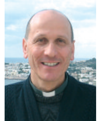
don Gerardo Antonazzo

La donna di Samaria è di fronte a Gesù, sottoposta, suo malgrado, ad uno sguardo che la attraversa interiormente, e la imbarazza. Gesù sa bene che la donna sceglie quell'ora per recarsi al pozzo inosservata, in un momento inusuale della giornata. Il suo tentativo di nascondimento deve cedere il passo all'ora inaspettata dello svelamento. Anche l'ora del mezzogiorno fa pensare al culmine della luminosità della giornata. Lei viene accolta dallo Sconosciuto con cui non aveva nessun appuntamento, e Gesù, con grande delica-