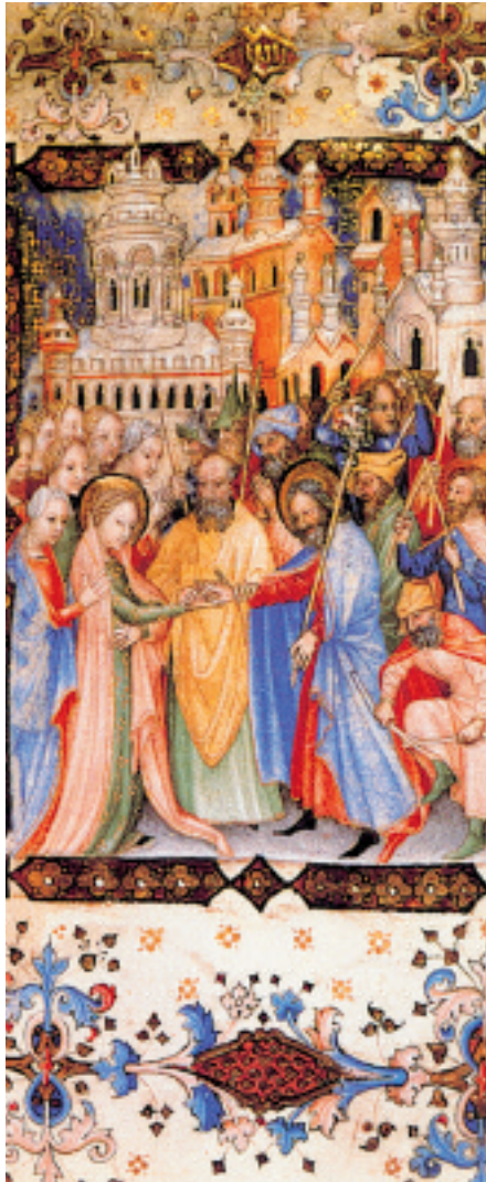
Giovannino de' Grassi, Sposalizio della Vergine

merosi lavori, pene e stanchezze. Sono i Sì della vecchiaia al tramonto di una vita di fedeltà, che esprimono il consenso perfetto di due esseri l'uno verso l'altro e completano questa unione che ne è l'opera e