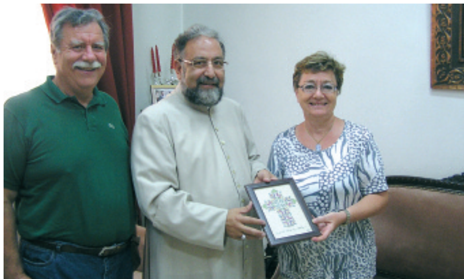
S.E. Mons. Boutros Marayati, vescovo armeno cattolico di Aleppo (ex consigliere spirituale di Aleppo 2)

un messaggio di pace per quella terra martoriata e che dischiuda una nuova era di riconciliazione tra le END dei due paesi