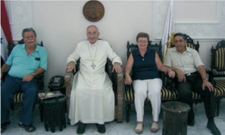
S.E. Mons. Joseph Arnauti vescovo armeno cattolico di Damasco (che celebrò il matrimonio di Antoine e Leyla)

18 Un argomento che ci coinvolge è il rapporto con le coppie che creano difficoltà alla vita della END. È bello l'esempio usato dagli amici i quali dicono che se un dito fa male, non si può tagliare la mano. Ci troviamo tutti d'accordo nell'uso fondamentale della virtù della pazienza, ma concordiamo anche che, accanto ad essa, occorrerebbe esercitare un seconda virtù suggerita dal metodo, quale la correzione fraterna. L'esercizio della correzione fraterna, svolto con prudenza e con sensibilità, dovrebbe essere preferibilmente esercitato dalla coppia responsabile e potrebbe trovare spazio nel corso della pre-riunione, che vede presenti sia la coppia responsabile sia la coppia problematica. Il ruolo di coppia responsabile, esercitato in questi casi con cautela e amorevolezza, potrebbe favorire un'integrazione sempre più profonda tra le coppie.