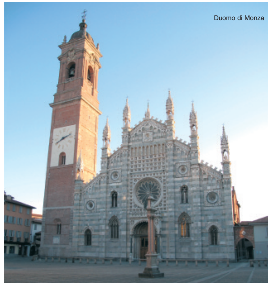
Duomo di Monza

Scoprire questo luogo, la sua storia, il bellissimo museo del Duomo, è certamente una esperienza da consigliare a quanti si trovassero a passare da queste parti.