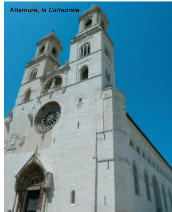
Altamura, la Cattedrale

Al loro ritorno, gli apostoli raccontarono a Gesù tutto quello che