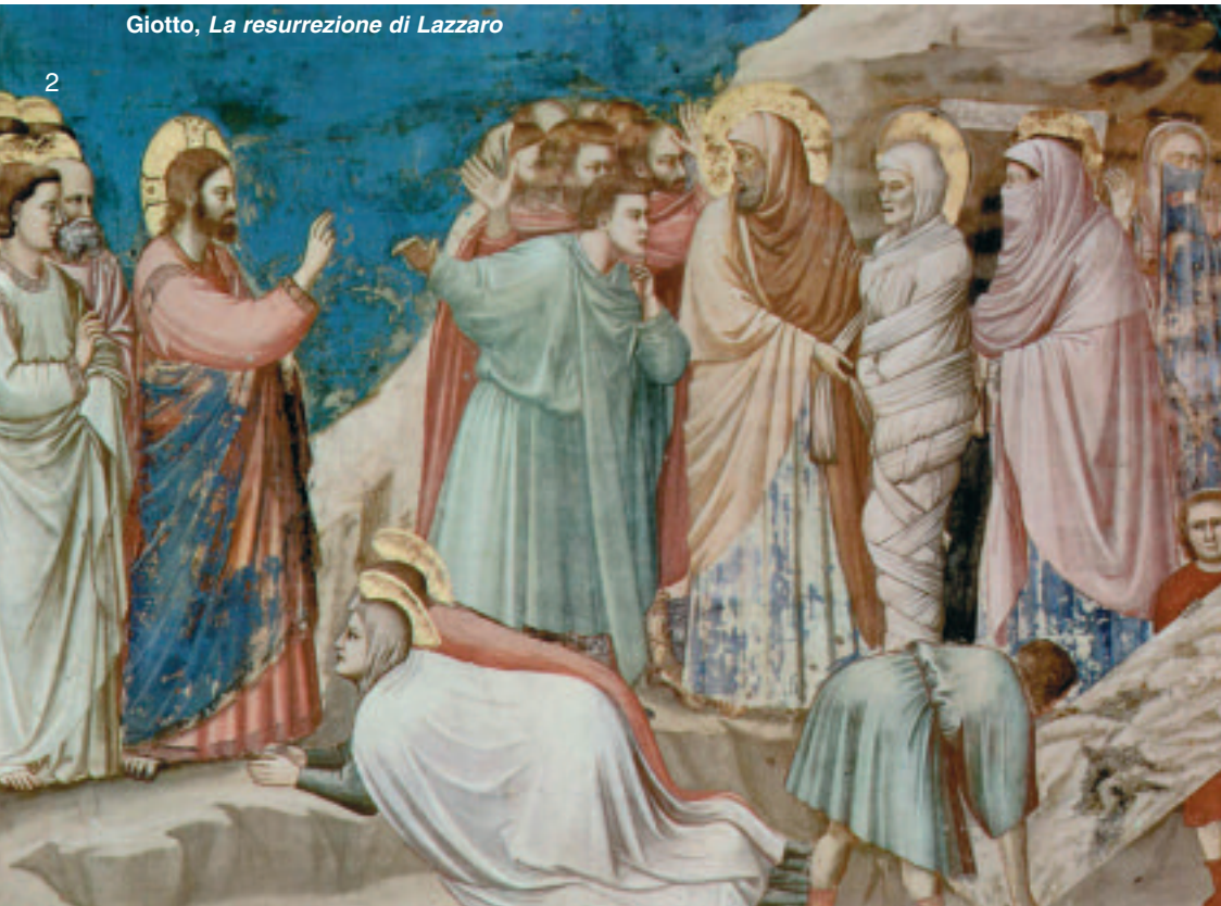
Giotto, La resurrezione di Lazzaro

Oggi, sempre più spesso, si parla di famiglia allargata, dove l'uomo che c'è non è il padre dei figli, ma solo l'amico della mamma. Quante storie di tante famiglie irrompono nel nostro cuore e rompono la pace delle nostre sicurezze. Non c'è poi tanta differenza tra queste situazioni e quella della donna di Sicar!