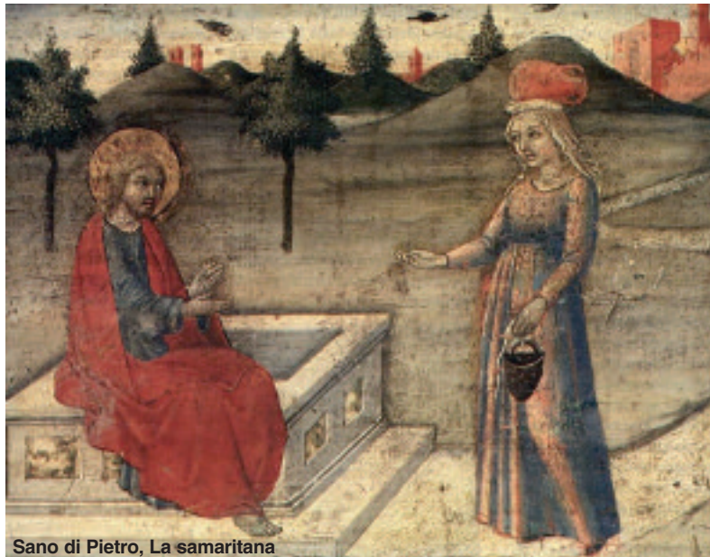
Sano di Pietro, La samaritana

Se viviamo in questo desiderio ecco che anche noi possiamo “dimenticare le nostre brocche” i nostri assilli quotidiani, li ritroveremo trasformati ac-