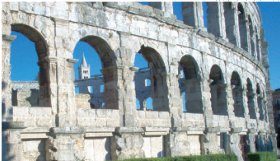
Anfiteatro romano di Pola