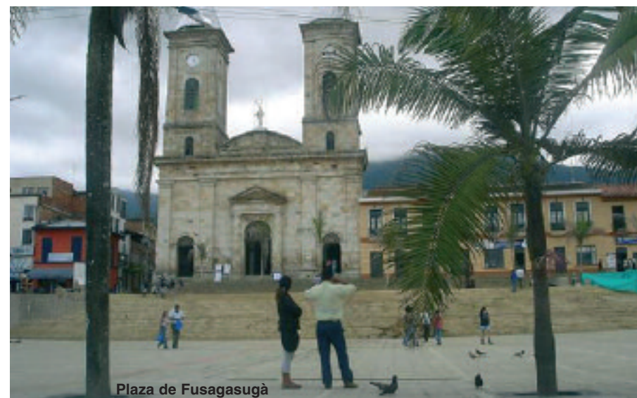
Plaza de Fusagasugà

Tutte le Coppie Super Regionali, le Coppie Responsabili delle Regioni direttamente legate all'ERI, i sacerdoti e i traduttori, che erano arrivati la vigilia a Bogotá, sono stati ospitati dagli équipiers e il giorno