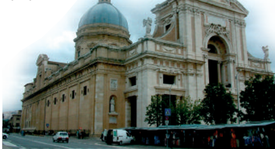
Basilica Santa Maria degli Angeli, Assisi

nell’archivio del Signore non esistono tomi che elenchino i nostri peccati, giacché Suo Figlio li ha cancellati