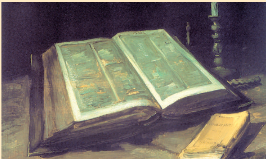
Van Gogh, Natura morta con Bibbia e candelabro

Personalmente la domenica o il giorno di festa, oggi, lo sentiamo davvero come un giorno particolare nel quale cerchiamo di riposare, nel senso del non sentirsi affaticati e affannati nel realizzare tutto quello che durante la settimana è rimasto in sospeso. Cerchiamo, se possibile, di rimanere in città, anzi a casa, di sentire il tempo che scorre in modo diverso, di riassaporare il gusto di trovarci insieme. La nostra vita è piena di parole, parole nel lavoro, parole da ascoltare, parole che leggiamo sul giornale, parole che ascoltiamo al telefono, alla televisione, alla radio e... quali momenti ci restano per pensare, per fare un po' di silenzio attorno a noi e dentro di noi, per fare un po' di vuoto perché la parola del Signore possa ancora illuminare la nostra strada?