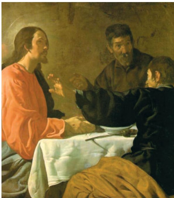
Velasquez, La cena di Emmaus

due di loro erano in cammino per un villaggio distante circa sette miglia da Gerusalemme, di nome Emmaus, e conversavano di tutto quello che era accaduto. Mentre discorrevano e discutevano insieme, Gesù in persona si accostò e camminava con loro (Lc 24, 13-15).