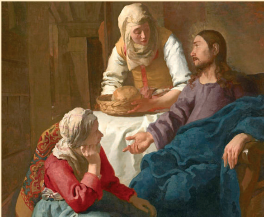
Vermeer, Cristo in casa di Marta e Maria

Il lavoro nel Nuovo Testamento assume un significato diverso; intanto non fa propria la concezione ellenistica che disprezza il lavoro manuale, e infatti annota come normale la condizione del lavoro: Gesù è "carpentiere" o "figlio del carpentiere" (Mc 6,3; Mt 13,55), gli apostoli sono pescatori o fanno altri mestieri. Attraverso i testi presenti nel Nuovo Testamento intuivamo il senso che il lavoro ha agli occhi di Dio. In particolare l'analisi del testo di Marta e Maria (Lc