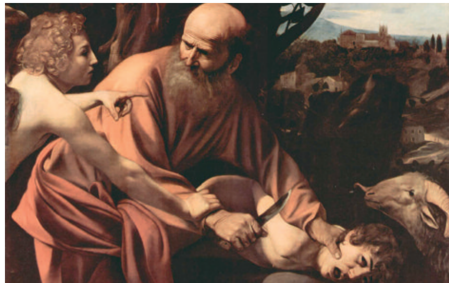
Caravaggio, Il sacrificio di Isacco

Shema’, ascolta, ascoltate! e abbiamo imparato ad ascoltarlo e a scoprirlo vicino nella nostra quotidianità che è Parola quando la sofferenza ci impedisce di discernere: Signore, io non ho nessuno che, quando l’acqua è mossa, mi metta nella vasca (Gv 5,7), quando i nostri limiti ci “paralizzano: alzati, prendi la tua barella e va’ a casa tua (Mc2,11), quando la delusione ci toglie il coraggio di riprogettare, quando ci sentiamo inadeguati nel cammino di santità che ci propone.